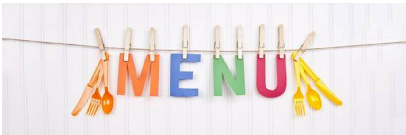
TABELLE DIETETICHE E MENU'

Il team dell'ufficio dietetico di all'RTI Elio Risturazione spa – Sh Gestioni srl, ha realizzato per il Comune di Pescara un programma alimentare fondato sui principi della mensa biologica, sulla base delle Linee di indirizzo Nazionale del Ministero della Salute e le linee guida previste dall'INRAN, nonché sul rispetto della stagionalità e delle indicazioni previste dal Capitolato Speciale redatto dall'Amministrazione Comunale.