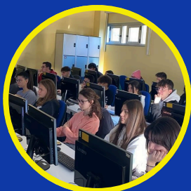
02. CULTURA SCIENTIFICA E STEM