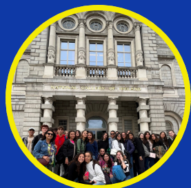
01. COMUNICAZIONE E LINGUAGGI