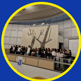
04. CITTADINANZA CONSAPEVOLE